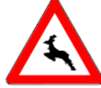
(T-14b) VAHŞİ HAYVANLAR GEÇEBİLİR

Bu işaret levhaları, yol üzerinde bir hayvan olabileceğini ve/veya hayvanların geçiş yaptıkları bir kesim olduğunu ve aynı zamanda kaplama üzerinde kir ve çamur olabileceğini belirtmek için kullanılır.