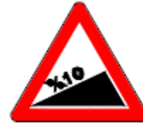
(T3b) TEHLİKELİ EĞİM (Çıkış)

Bu işaret levhaları, tehlikeli olduğu düşünülen iniş ya da çıkış eğimli yol kesimlerini gösterir ve sürücülerin düşük vites kullanmaları gerektiğini bildirir.