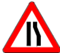
(T-4b) SAĞDAN DARALAN KAPLAMA