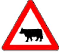
(T-14a) EHLİ HAYVANLAR GEÇEBİLİR