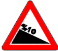
(T-3a) TEHLİKELİ EĞİM (İniş)