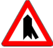
(T-23 a) SAĞDAN ANA YOLA GİRİŞ

Bu işaret levhaları, bir tali yol kavşağına yaklaşılmakta olduğunu, bu işaretin kullanıldığı yoldaki trafiğin ilk geçiş hakkına sahip bulunduğunu ve tali yoldan yaklaşmakta olan sürücülerin ana yola girmeden önce yol vermelerinin veya durmalarının gerekli olduğunu bildirir.