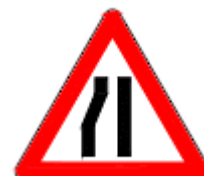
(T4-c) SOLDAN DARALAN KAPLAMA

Bu işaretler, devamlı veya geçici nedenlerle yol kaplamasının her iki taraftan veya sağdan-soldan önlem almaksızın yan yana geçemeyebilecekleri kesimleri belirtmek amacı ile kullanılır.