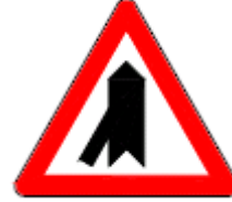
(T-23b) SOLDAN ANA YOLA GİRİŞ

Bu işaretler, tek yönlü ve bölünmüş yola katılan yan yollar veya köprülü kavşakların bağlantı yollarına yaklaşıldığını bildirmek için kullanılır.