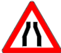
(T4-a) İKİ TARAFTAN DARALAN KAPLAMA

Bu işaret levhaları, tehlikeli olduğu düşünülen iniş ya da çıkış eğimli yol kesimlerini gösterir ve sürücülerin düşük vites kullanmaları gerektiğini bildirir.