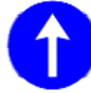
(TT-35c) İLERİ MECBURİ YÖN