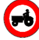
(TT-15) TRAKTÖR GİREMEZ

Bu işaret levhalarının yerleştirilmiş olduğu yola, üzerinde şekli bulunan araçların giremeyeceğini bildirir. Bu işaret levhaları yüksek hızlı çok şeritli karayolları, ekspres yollar vb. yollarda tehlike ve uygunsuzluk meydana getirebilecekleri yol ve caddelere girişinin engellenmesi amacıyla kullanılır.