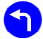
(TT-35d) TT-35h) İLERİDE SOLA MECBURİ YÖN

Bu işaret levhaları sürücülerin levha üzerinde belirtilen istikameti takip etmek zorunda olduklarını bildirir.