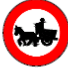
(TT-13) AT ARABASI GİREMEZ