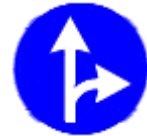
(TT-35d) İLERİ ve SAĞA MECBURİ YÖN