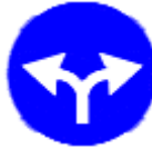
(TT-35f) SAĞA ve SOLA MECBURİ YÖN