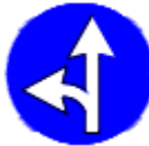
(TT-35e) İLERİ ve SOLA MECBURİ YÖN