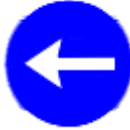
(TT-35b) SOLA MECBURİ YÖN