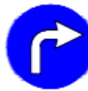
(TT-35g) İLERİDE SAĞA (MECBURİ YÖN)