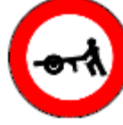
(TT-14) EL ARABASI GİREMEZ